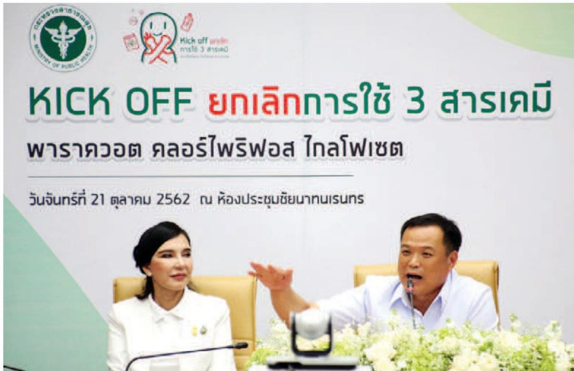
แบน 3 สารพิษ : นายอนุทิน ชาญวีรกูล รองนายกรัฐมนตรี รวม.สาธารณสุข พร้อมด้วย น.ส.มนัญญา ไทยเศรษฐ์ รมช.เกษตรและสหกรณ์ พร้อมด้วยข้าราชการกระทรวงสาธารณสุข ย้ำจุดยืนการแบนสารอันตราย “Kick okk ยกเลิกการใช้ 3 สารเคมี”