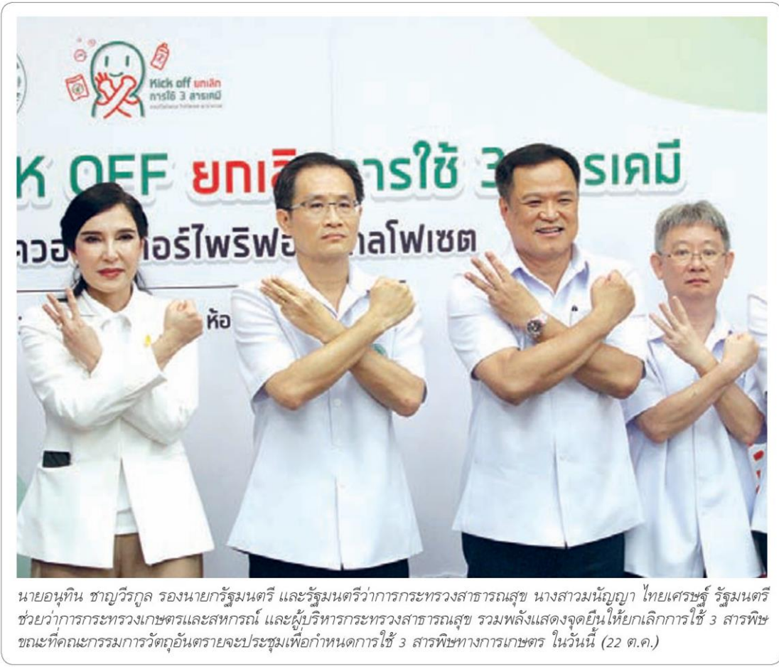
นายอนุทิน ชาญวีรกูล รองนายกรัฐมนตรี และรัฐมนตรีว่าการกระทรวงสาธารณสุข นางสาวณัฏฐา ไทยเศรษฐ์ รัฐมนตรีช่วยว่าการกระทรวงเกษตรและสหกรณ์ และผู้บริหารกระทรวงสาธารณสุข ร่วมพลังแสดงจุดยืนให้ยกเลิกการใช้ 3 สารพิษ ขณะที่คณะกรรมการว่าด้วยอันตรายจะประชุมเพื่อกำหนดการใช้ 3 สารพิษทางการเกษตร ในวันที่ (22 ต.ค.)